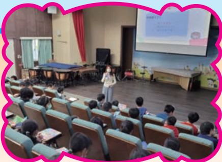
六年級升學輔導講座