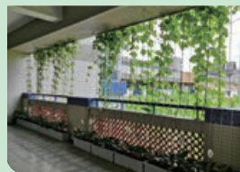
驕陽下綠簾隔熱降溫，夢簾後的秘密地