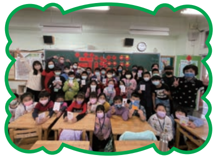
寒假英語奠基營 讓英語學習非雜事