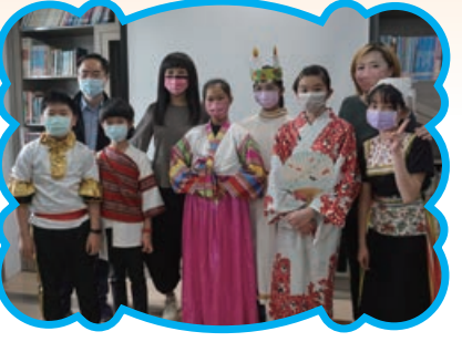
林口圖書館活動中 展現雙語成果