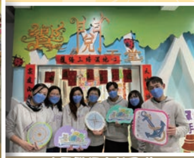
校長帶領南勢團隊獲教學卓越獎優等肯定