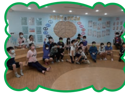
圖書館閱讀闖關活動