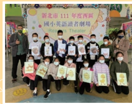
502 班西區讀者劇場競賽榮獲優等