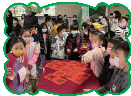
春聯義賣 讓學習成果更有意義