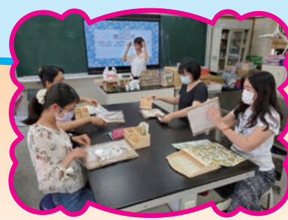
環境教育 - 蝶谷巴特課程