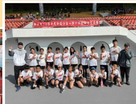
徑隊於對抗賽斬獲佳績