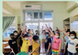
酷熱的天氣下有優質學習環境~ YA 有冷氣囉！