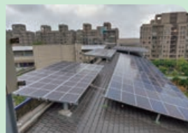
教學大樓頂增設太陽能板，綠能環境增加收益