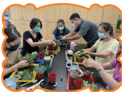
環教課程 - 多肉植物的異想世界