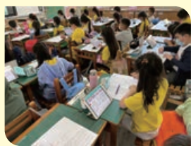
科技融入讓學習更加分