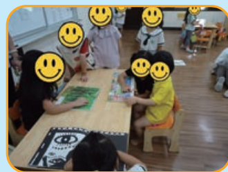
小組共讀學習活動