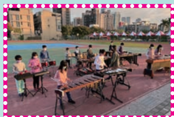
放學後彩排運動會節目

藝術源於生活，每種藝術都是在感官知覺的引領下開始，打擊樂團不單單只是演奏樂器而已，沒有經過時間的淬鍊與磨練，很難達到一定程度的水準，需要長時間的浸潤才會慢慢顯化。