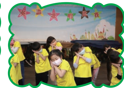
英語歌唱比賽 展現英語學習成果