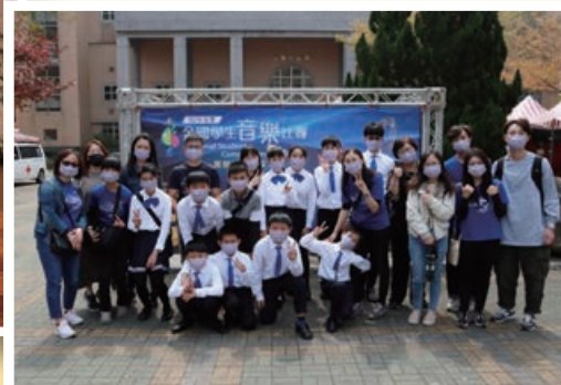
打擊樂隊於全國學生音樂比賽榮獲優等