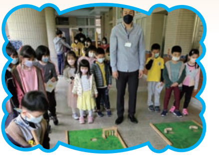
兒童節闖關 - 寓教於樂