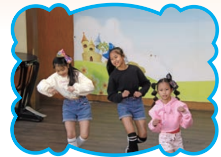
星世代小藝人 - 多元展能