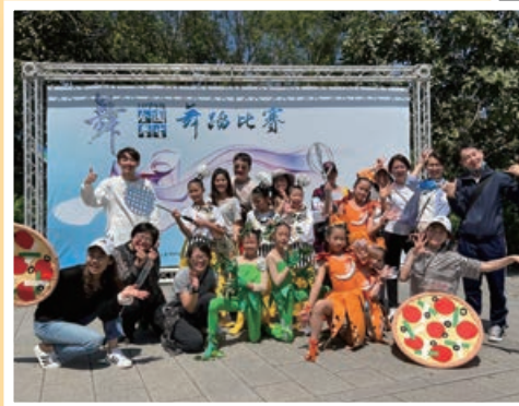
舞蹈隊於全國學生舞蹈比賽榮獲優等