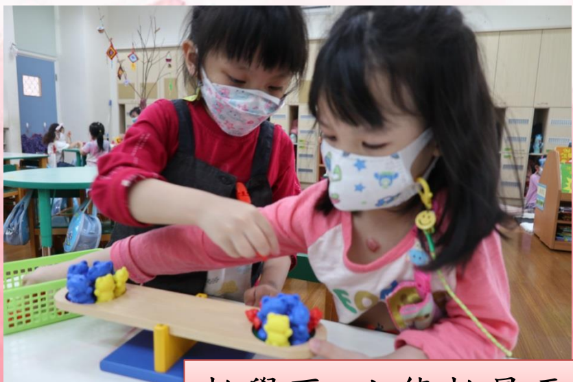
數學區-小熊數量平衡