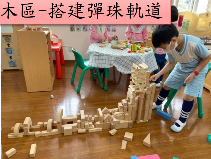
積木區-搭建彈珠軌道