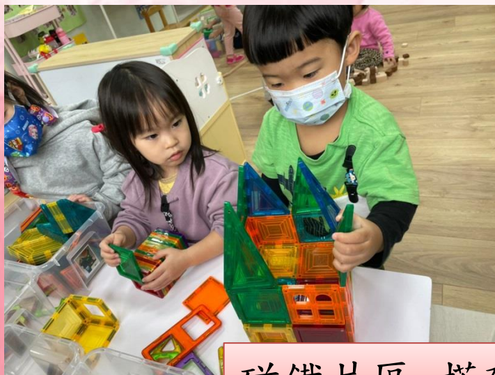
磁鐵片區-搭建房子