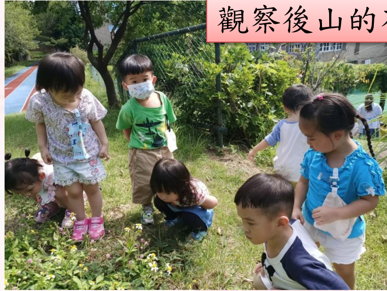
觀察後山的花花草草