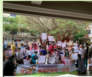
祖孫動健康一日營 25組祖孫，共50位參與