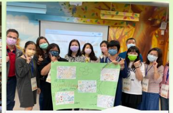
親職團體課程-幸福甜甜圈 15位家長參與(4次課程)