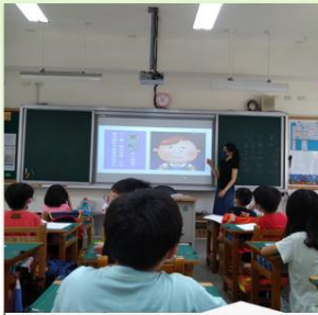
當我們童在一起情緒教育課程 低年級8個班級參與