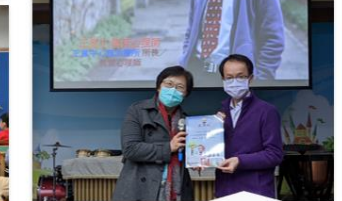
親職講座-如何拆解孩子的情緒地雷 61位家長實體參與