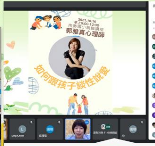
親職講座-與孩子談性說愛 51位家長線上參與