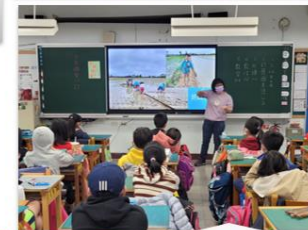
晨光故事好時光 17個班級參與