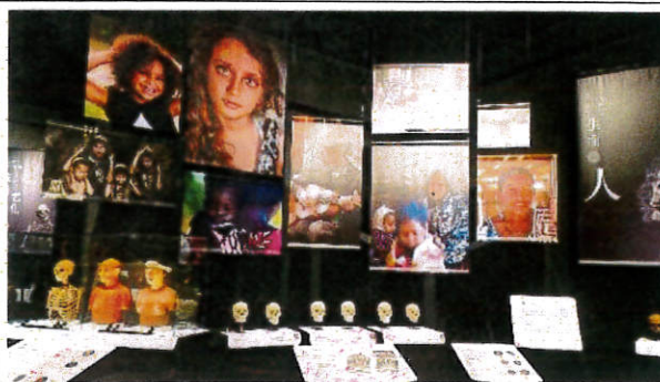
說明：特展內容精彩，布置主題鮮明、動線流暢。