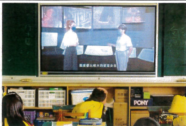
說明：於行前收看特展介紹影片。