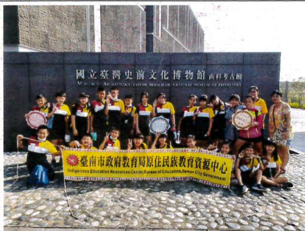
說明：原住民族教育-國立台灣史前文化博物館