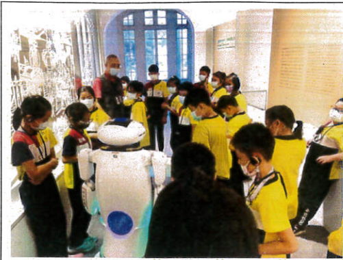
說明：巧遇 AI 智能導覽機器人