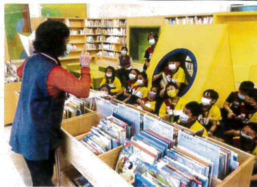
說明：學生專心聆聽原住民百步蛇的故事