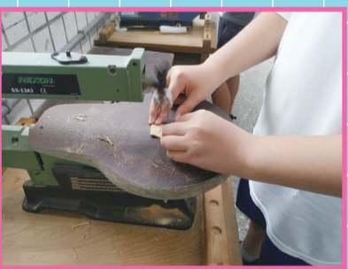
▲學生正熟練地使用著木雕機。

這學期延續上學期的實作課程，繼續動手做實用小物，這學期老師教學生製作了大象膠帶臺、木製名片架等作品，一開始學生在操作木雕機時總是小心翼翼，但是經過一學期的練習後，現在操作木雕機已經非常熟練，很快就能利用木雕機雕刻出想要的形狀！