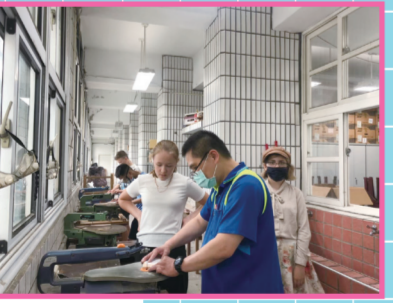
▲老師正在指導學生如何安全的操作木雕機。