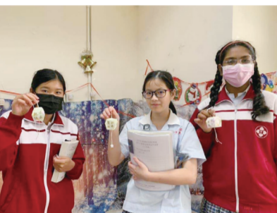
▲學生展示自己做的天燈

為了讓雙語班及語教班學生體驗元宵節，老師們特別安排了手作祝福天燈及紅包袋燈籠的活動，帶領學生們動手做天燈，並且在天燈掛上各種有趣的雙語燈謎，讓每個學生都可以享受解燈謎樂趣！除了製作小天燈，老師們還帶領學生運用紅包袋來製作燈籠，以體驗節日文化。