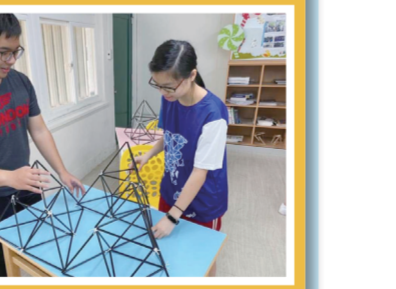
▲老師正在協助學生改善問題。