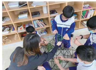
▲老師正在協助學生建構正四面體風箏。

數學老師們在教完幾何及數列後，為了接下來的三角形課程，精心設計與準備了一個很特別的課前活動，這節課，老師們要帶學生們一起動手做正四面體風箏！做好風箏後再拿到操場試飛！同學們在不斷反覆試驗的結果下，順利的讓風箏在天空飛翔，成就感和意義也特別不一樣。我們希望學生能夠在友善並充滿支持的環境下學習，希望在這樣的課程中，孩子們都能從做中學，達到有效學習。