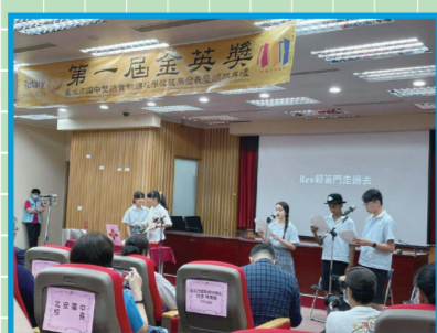
▲學生用英語廣播的方式呈現。

恭喜孩子們在金英獎英文講演比賽中榮獲最佳創意獎！雙語生和本籍生合作，在表藝老師和外師的領導下，收穫了努力的成果，再次恭喜！