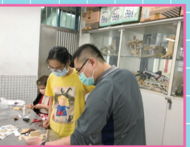
▲老師正在檢視學生的作品