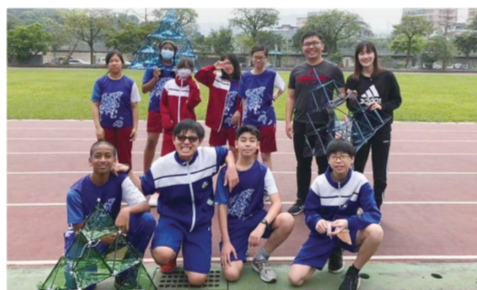
▲試飛大成功！師生合影