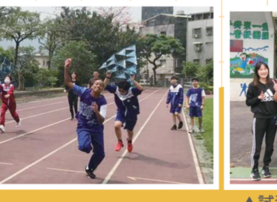
▲試飛大成功！師生合影