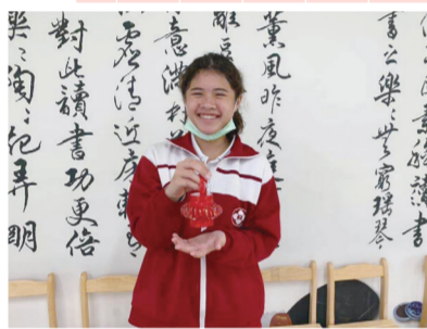
▲學生自己做的燈籠