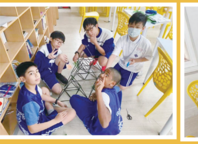
▲學生開心的展示他們做好的風箏骨架。