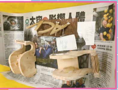
▲學生製作的大象膠帶臺及名片架。