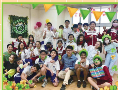
▲810導師帶領班上同學一起來參加聖派翠克節