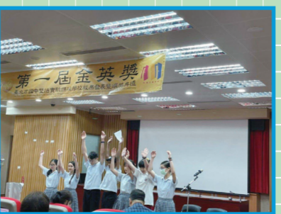
▲表演精彩，榮獲最佳創意獎。