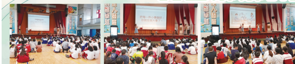
▲社群媒體經營苦澀談 706 吳妘濤