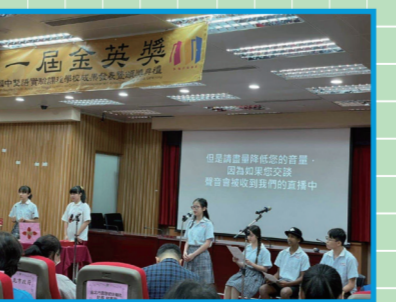
▲這次的比賽由雙語班學生和普通班學生一起參加。