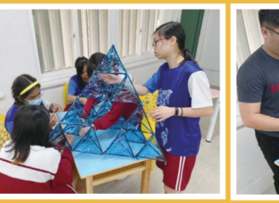
▲學生做好正四面體風箏的骨架後，接著黏貼玻璃紙。