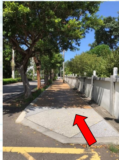
沿著步道進入幼兒園門口