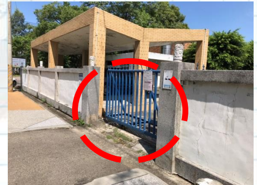
幼兒及家長請由西側門進入