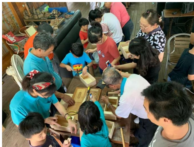
說明:學校於社區張氏農場舉辦親子活動