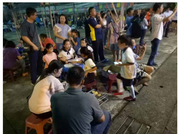
說明：參與社區中秋烤肉活動