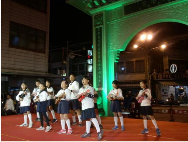
說明：參與社區永安宮表演-烏克麗麗