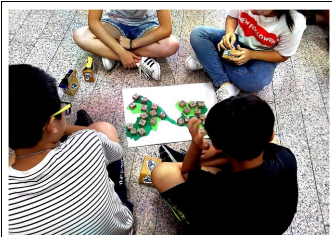
說明:新市區樹谷文化基金會到校舉辦活動