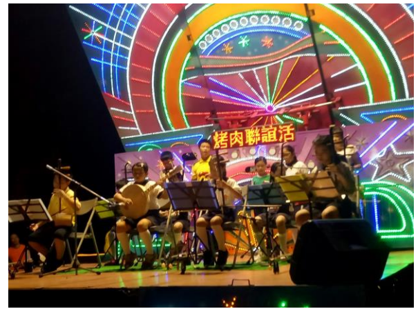
說明：參與社區北極殿表演-二胡