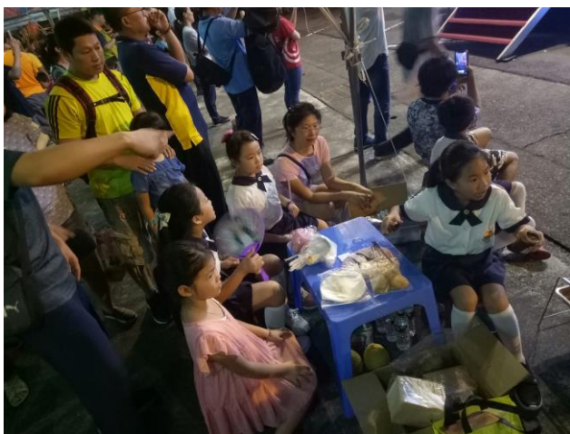
說明：參與社區中秋烤肉活動