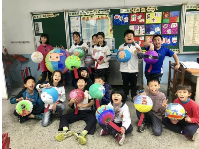
說明:參加社區東勢廟彩繪燈籠活動