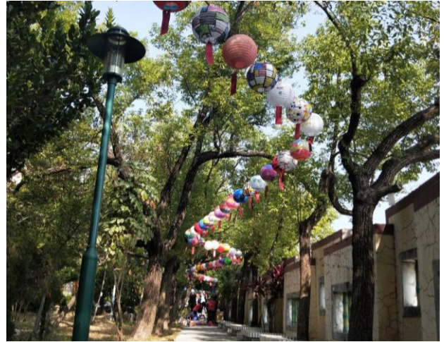
說明:參加社區彩繪燈籠活動