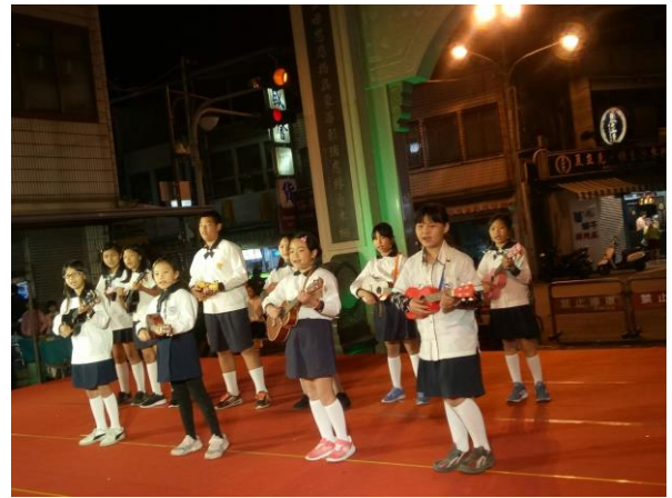
說明：參與社區永安宮表演-烏克麗麗