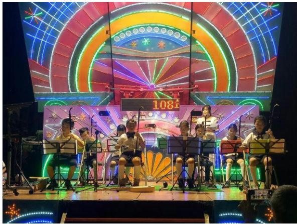
說明：參與社區北極殿表演-二胡