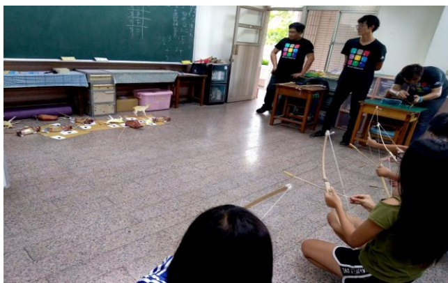
說明:新市區樹谷文化基金會到校舉辦活動