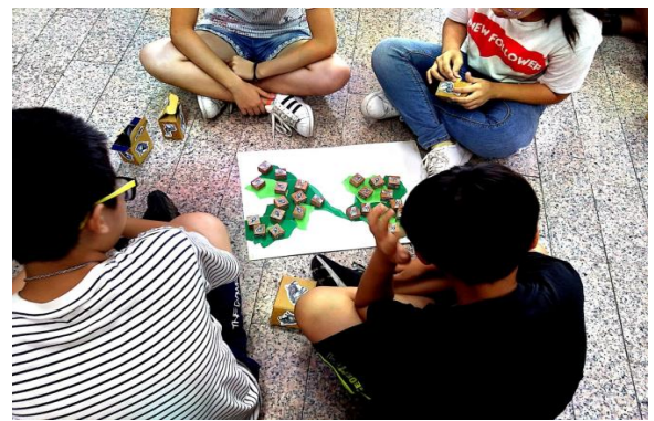
說明:新市區樹谷文化基金會到校舉辦活動