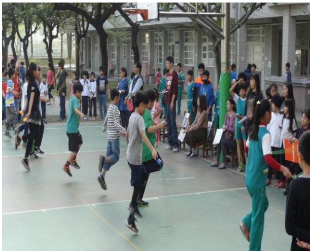
說明：期末跳繩比賽