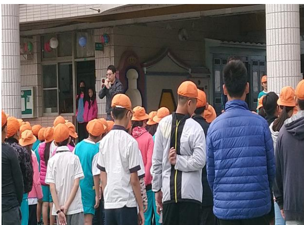
說明：學校推行不帶含糖飲料入校園