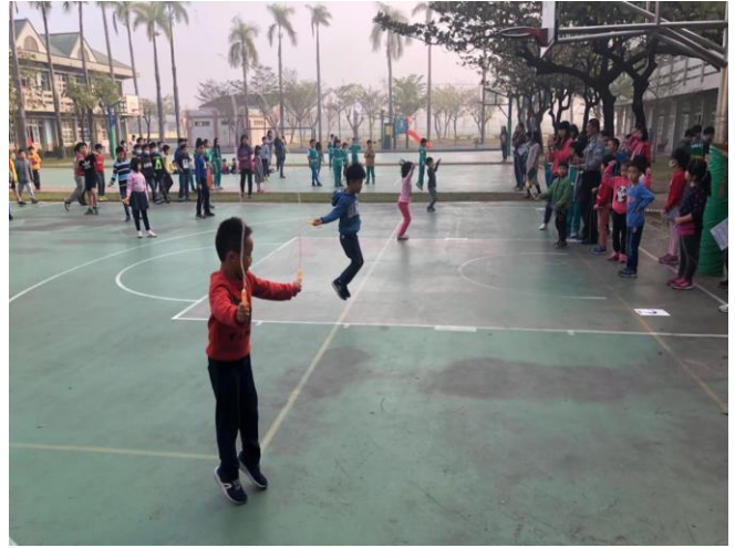
說明：期末跳繩比賽