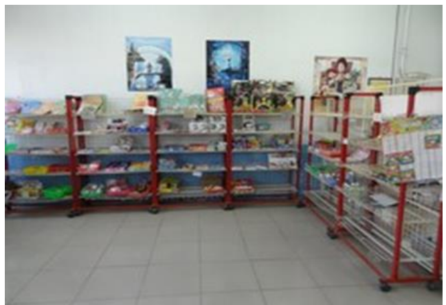
說明：學校不提供含糖飲料-合作社不賣食物. 只賣文具