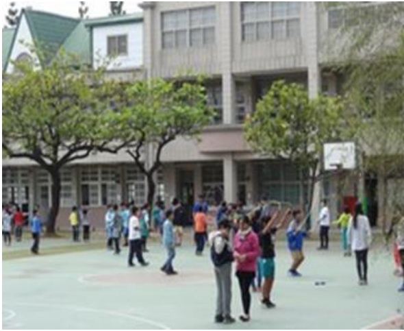
說明：健康體能計畫-大家一起來跳繩