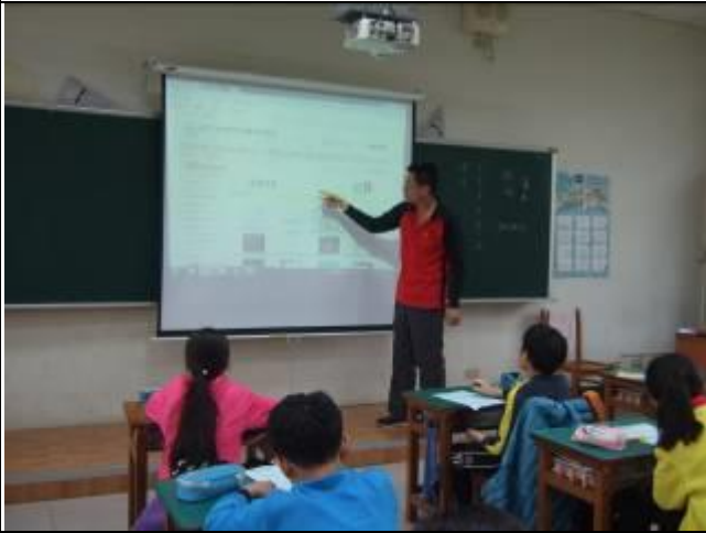
照片說明：全民健保網站