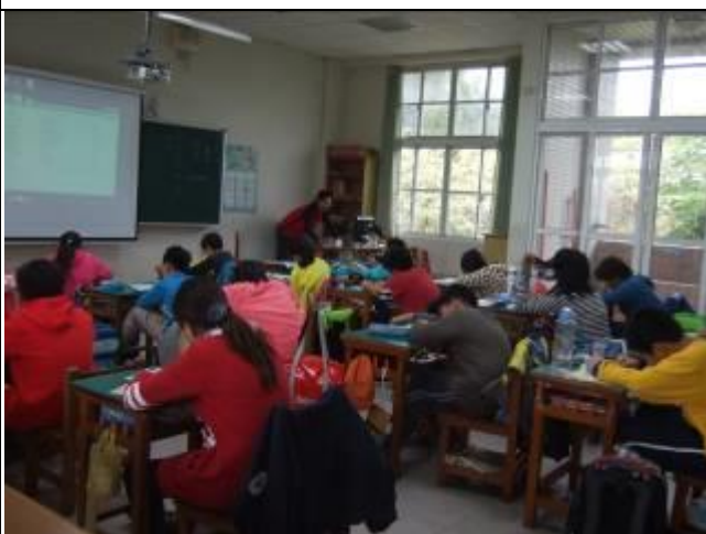
照片說明：填寫學習單