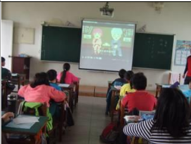
照片說明：影片宣導