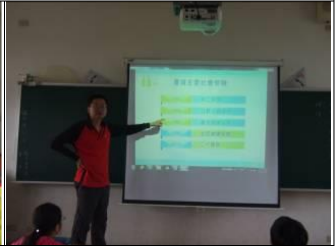
照片說明：全民健保業務說明