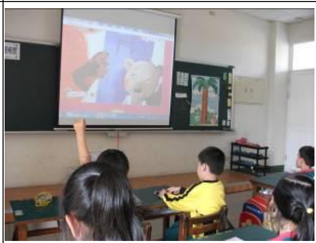
照片說明：討論分享正確的潔牙觀念。