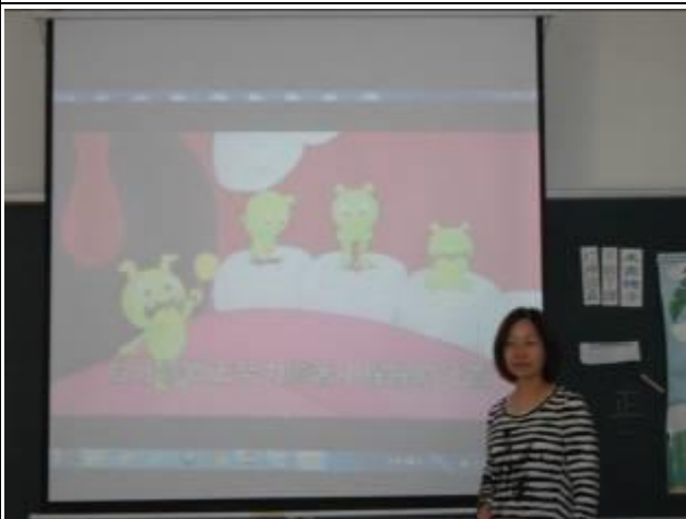
照片說明：播放影片：「蛀牙蟲 BYEBYE」，讓學生了解刷牙的重要。