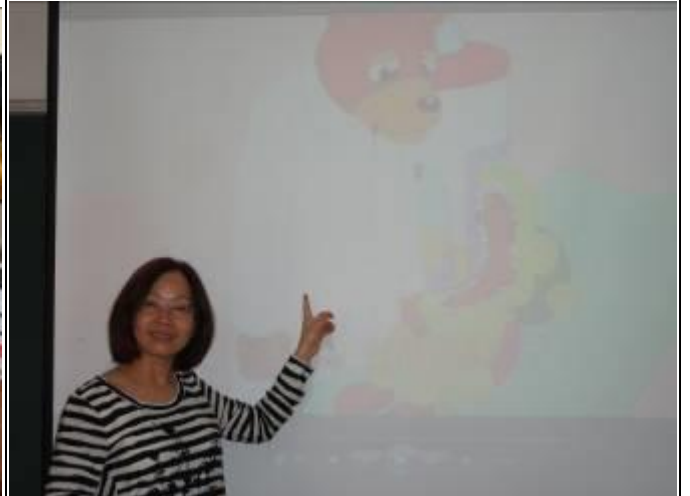
照片說明：播放「小熊包力刷牙記」，教導學生健康牙齒的重要性