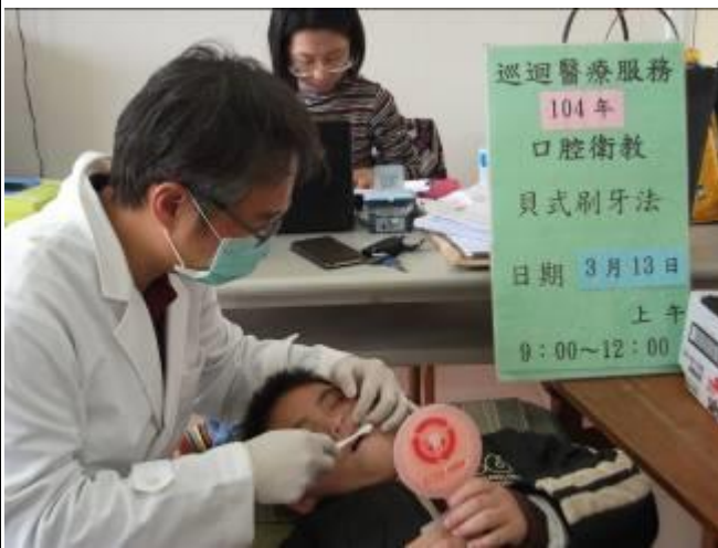
照片說明：牙醫師指導學生如何刷牙