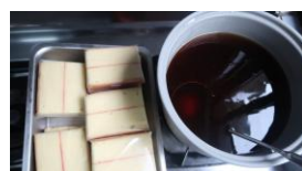
海綿蛋糕 冬瓜檸檬