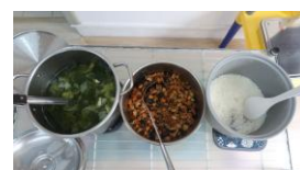
肉燥飯 青菜豆腐湯