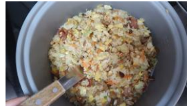
肉絲蛋炒飯 味噌湯