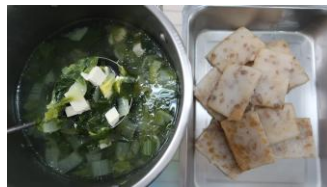
芋頭糕 青菜豆腐湯