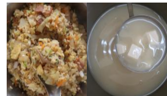
肉絲蛋炒飯 味噌湯