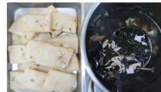
蘿蔔糕 X2 海苔蛋花湯