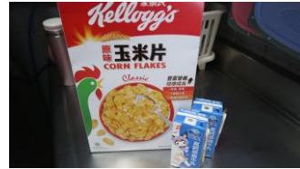
玉米脆片 牛奶(鋁箔裝)