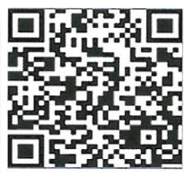
抽水馬達空氣阻塞排除影片