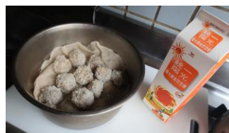
珍珠丸子 X2 豆漿