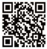
兒童發展篩檢影片