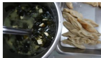
鍋貼 X2 日式味噌湯