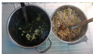
香菇栗子炊飯 紫菜蛋花湯