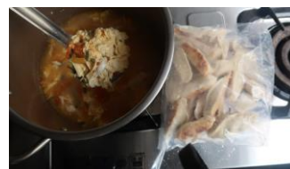
鍋貼 x2 番茄蛋花湯