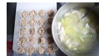
燒賣 x2 黃瓜魚丸湯