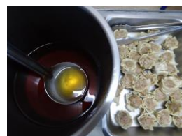
燒賣 x3 麥茶