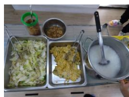
清粥小菜 (蔥蛋、高麗菜、麵筋)