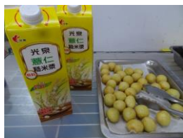
地瓜球薏仁糙米漿