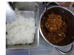
肉燥飯青菜豆腐湯