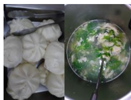
鮮肉包子青菜蛋花湯