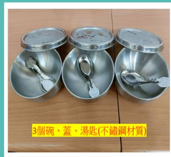
3個碗、蓋、湯匙(不鏽鋼材質)