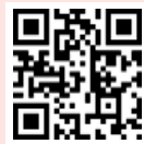
บันทึกผลการตรวจ

02 เข้าเว็บไซต์และดูผลการตรวจ (ไม่ต้องการเปิดเผยชื่อ) รับคู่มือแลกรางวัล และจับรางวัล