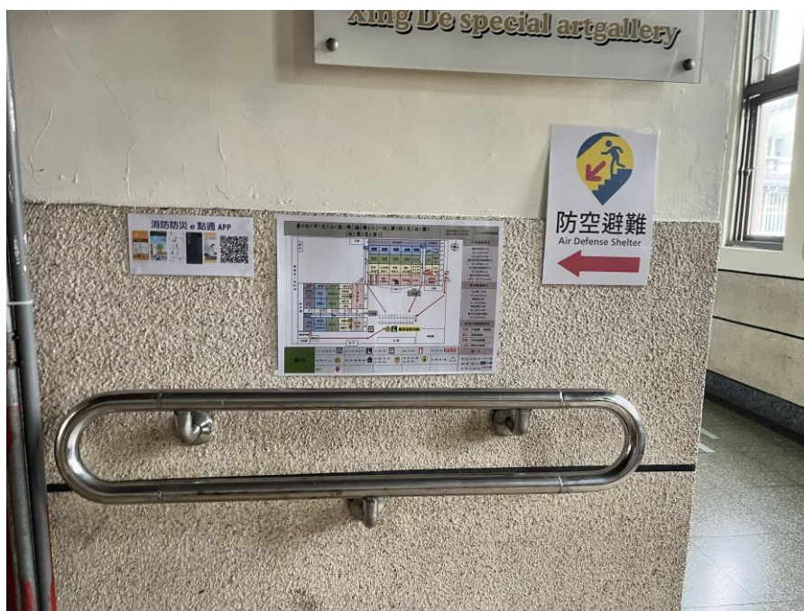
校內張貼或公告防災地圖及避難引導指標。