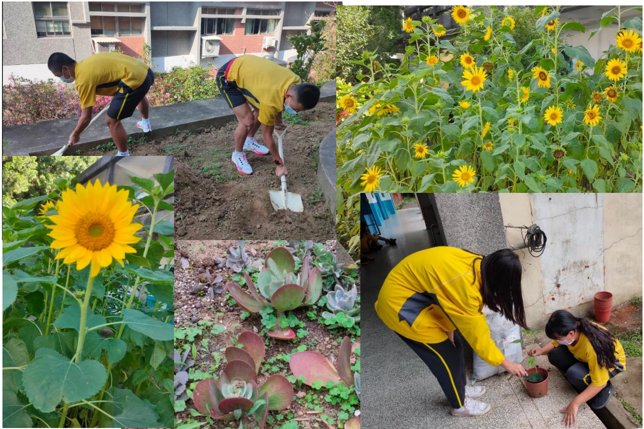
說明：【黃金-太陽花】及【白牡丹-多肉植物】流程：播種、植栽、開花結果。