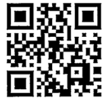
報名網址 QR CODE