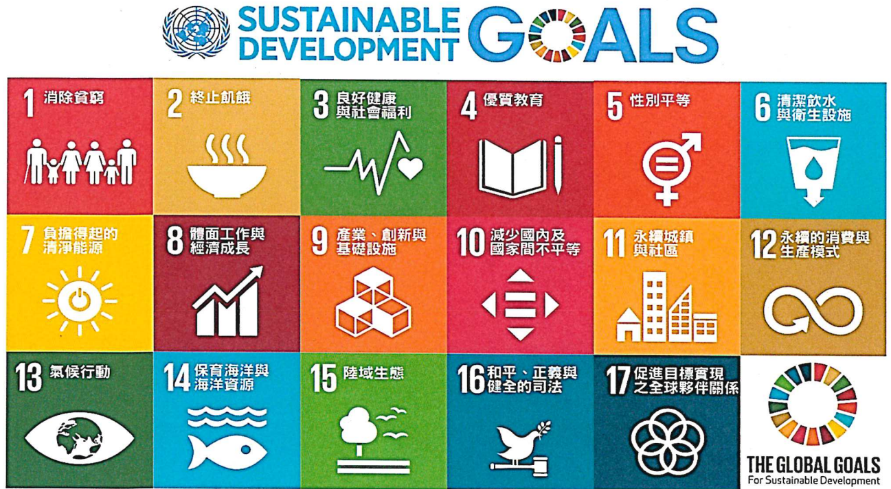
附件 1-2 各項目標之內涵