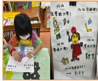
繪製 vuvu 的資料