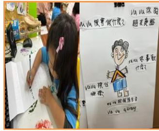
描寫訪問 vuvu 的問題