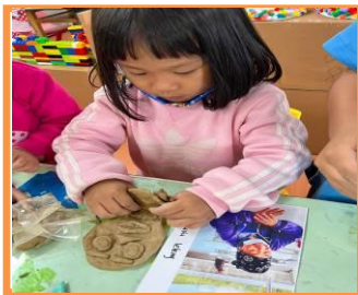
製作 vuvu 的樣貌

人偶組之幼兒先觀察照片裡 vuvu 的特徵，依照 vuvu 的外觀運用陶土製作 vuvu，完成後，隔日，幼兒發現部份的陶土已脫落，利用膠水、白膠及保麗龍膠做實驗，實作並觀察，瞭解保麗龍膠黏性最強，用保麗龍膠來修復 vuvu 掉落的部位；老師引導幼兒觀賞雕像的圖片，讓幼兒們表達出想法， 佳宸-雕像不會動、語臻-手上拿一本書、子蕎-認真讀書 等內容，啟發了幼兒們想把 umai vuvu 做成雕像，讓日後的弟弟妹妹也知道 umai vuvu 做了很多好事，值得大家尊敬！於是，在校園裡蒐集回收瓶罐、清洗、曬乾，搭建 vuvu 的身形，在過程中，發現材料不足，繼續尋找適合的素材，待下週完成 umai vuvu 的雕像。