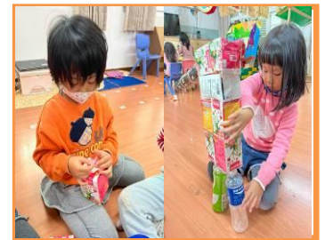
製作 umai vuvu 的雕像

週四上午全體師生共同參與文化活動—獵人體驗活動，包括:野炊、童玩體驗、獵具體驗（山豬、松鼠）等內容，由家豪老師介紹活動內容、流程及環境設備，接著，賴老師帶領全體師生與六年級哥哥姐姐介紹獵具的演進、使用方式、獸獵的陷阱、獵具設置的地方、實際體驗、野外求生的方式等活動，幼兒們分享體驗後的想法：覺得很好玩、很有趣、我們可以學到做陷阱的技巧；在鑽木的過程中，幼兒們嘗試用雙手在竹子由上往下持續磨擦下方的木板，但很困難，六年級的哥哥有挑戰成功，但手也破皮、受傷了，幼兒們體會到野外求生的辛苦，也學習到寶貴的經驗與技能，希望，未來能派上用場，學以致用。