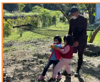
體驗獵具的使用方式