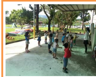
練習室內走路方式