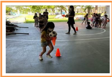
保持平衡 s 行跑