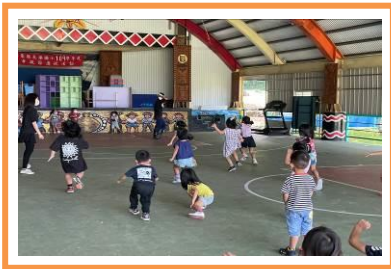
規則性遊戲-123 木頭人