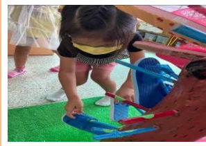
練習依顏色擺放拖鞋