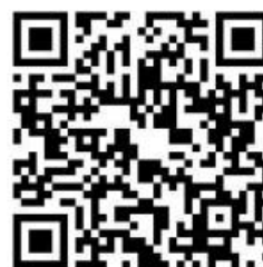
家長請假影音說明