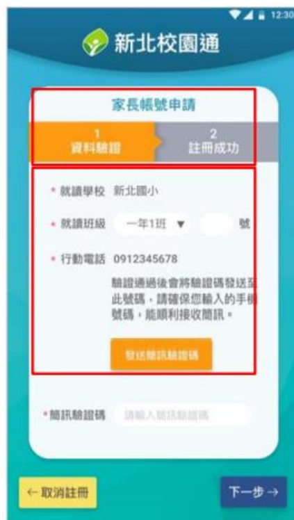
3. 雙重資料驗證 (子女資料比對、手機號碼簡訊驗證)