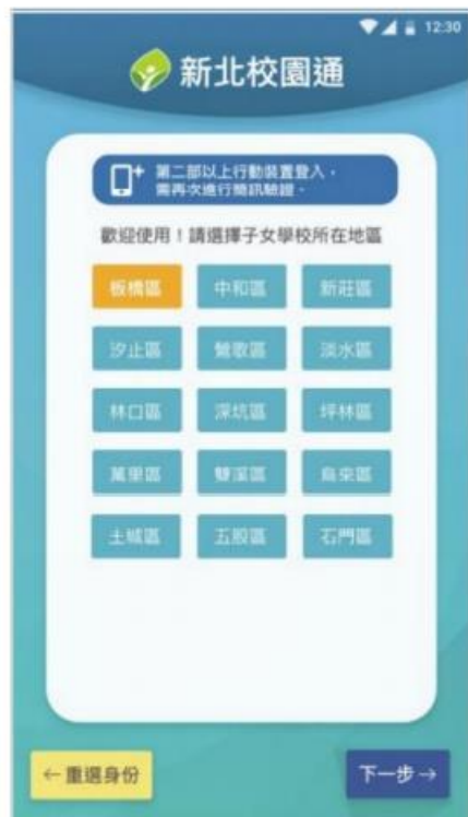
1. 選擇子女學校地區