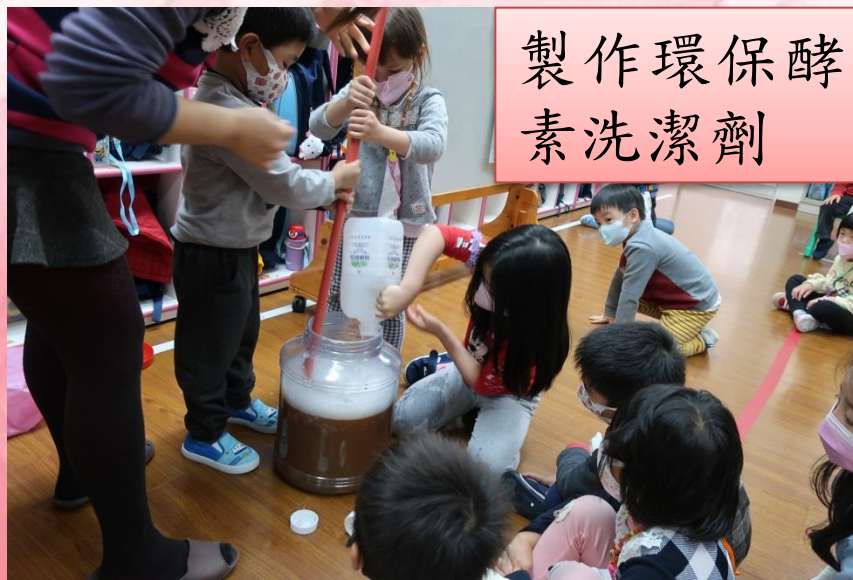
製作環保酵素洗潔劑