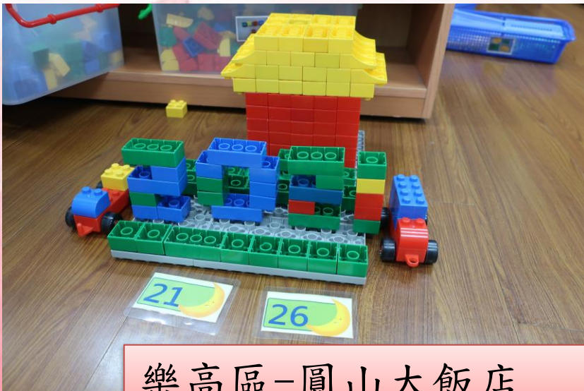
樂高區-圓山大飯店