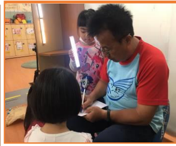
詢問楊大哥族名及涵意