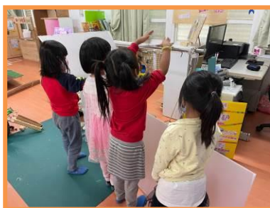
分享建構攝影棚的想法