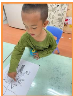
觀察攝影棚並做紀錄

延續上禮拜活動，孩子們票選出舞台最喜愛的設計圖，開始蒐集材料搭建舞台；另外，用來記錄影像的工具—相機孩子們好喜愛用，但在分享照片的過程中我們卻發現拍出來的照片太晃、影像不全面，為了解決這個問題，於是我們開始討論起攝影師是如何替影像拍出最完美的畫面，孩子們仔細觀察攝影師工作的地方（攝影棚），發現攝影師常會用燈光來打量影像作品、背景也會單純化不會亂亂的，於是我們開始觀察攝影棚的設置方式與元素，開始蒐集材料進行搭建。