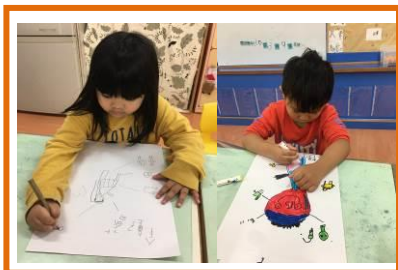
繪製個人自我介紹圖表