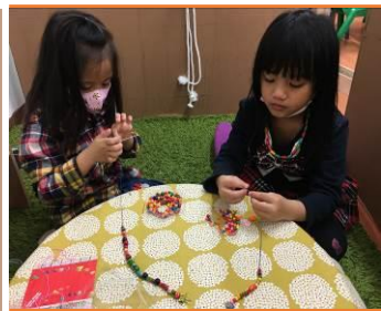
操作串珠區之情形