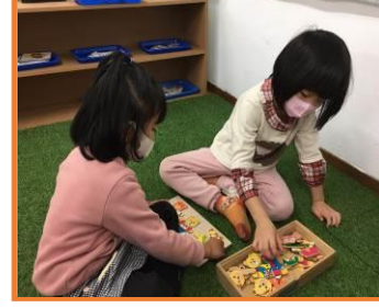
操作拼圖區之情形