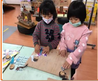
製作學習區負責人