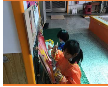
操作水彩區之情形