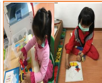
操作建構區之情形