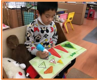
操作語文區之情形