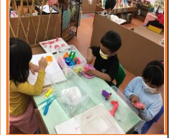
操作黏土區之情形