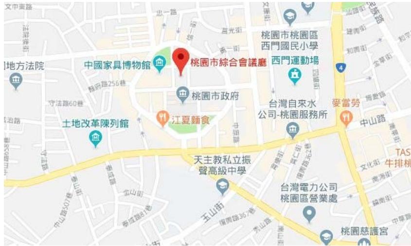
圖 2、桃園市綜合會議廳交通地圖