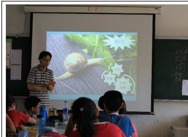
自然生態觀察教學