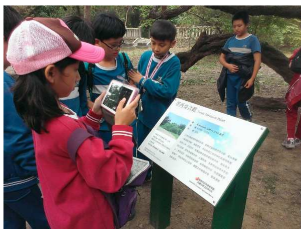
三崁店自然生態體驗