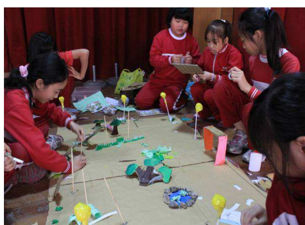
自然生態公園模型創作