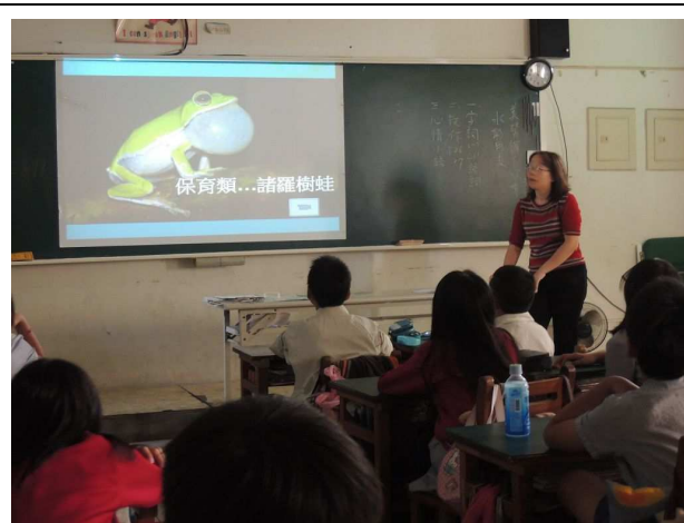
諸羅樹蛙的神奇故事