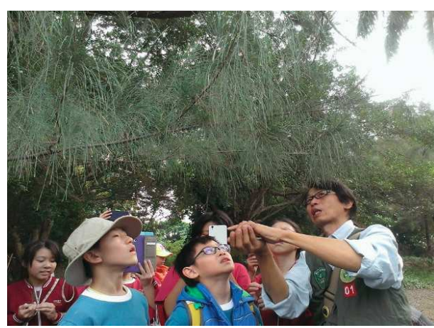
三崁店自然生態體驗