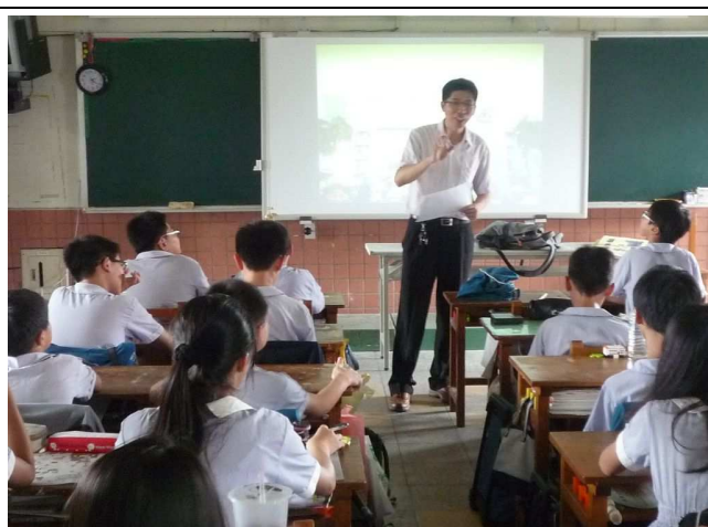
「人生的一堂課」~由校長授課