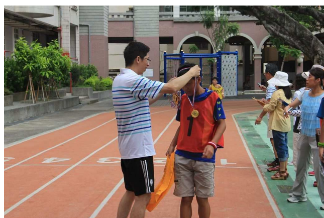
「村風少年 Pi」三公里路跑活動