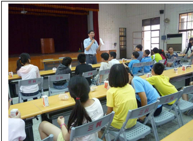
「我的校園生活」~與校長有約