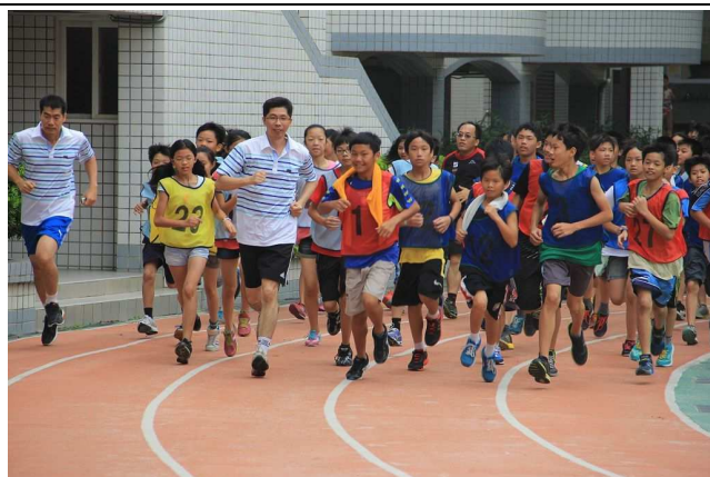
「村風少年 Pi」三公里路跑活動