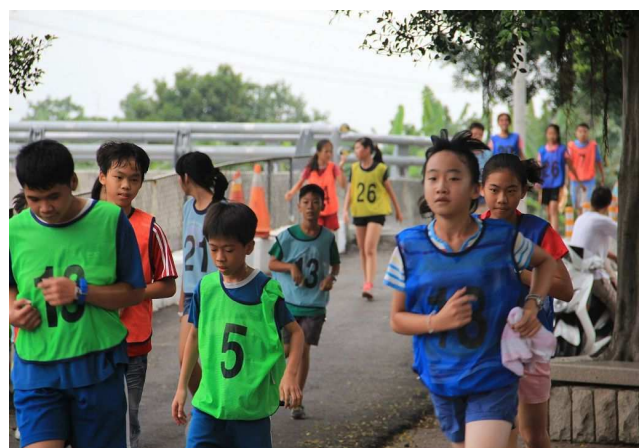
「村風少年 Pi」三公里路跑活動