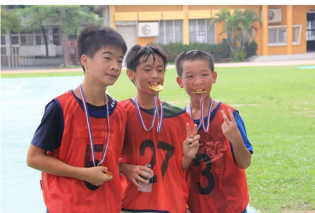
「村風少年 Pi」三公里路跑活動