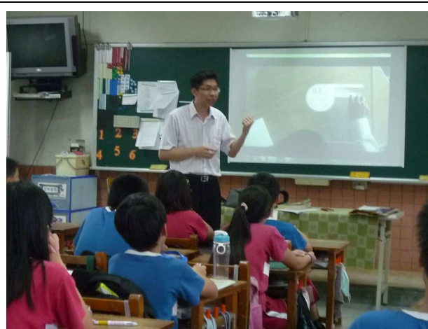
「人生的一堂課」~由校長授課