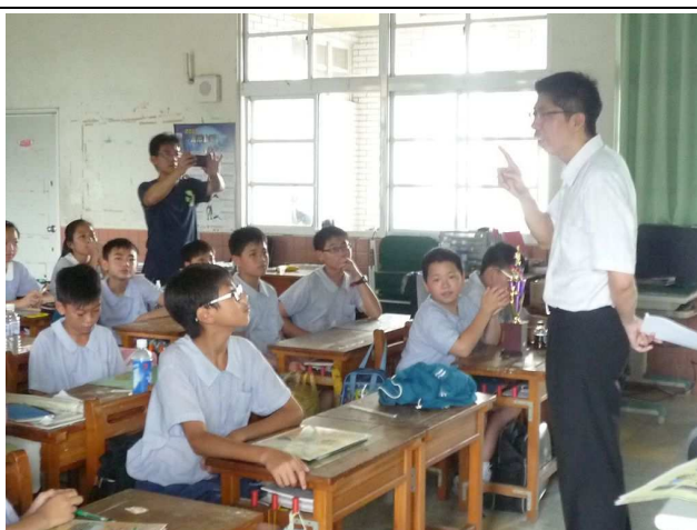
「人生的一堂課」~由校長授課