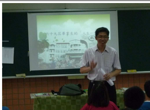
「人生的一堂課」~由校長授課