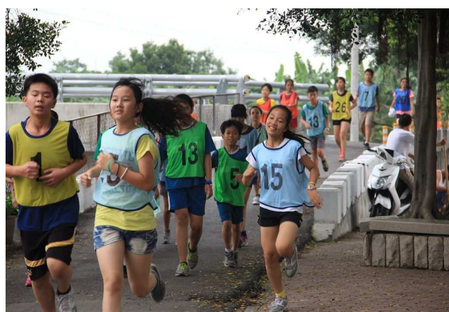
「村風少年 Pi」三公里路跑活動