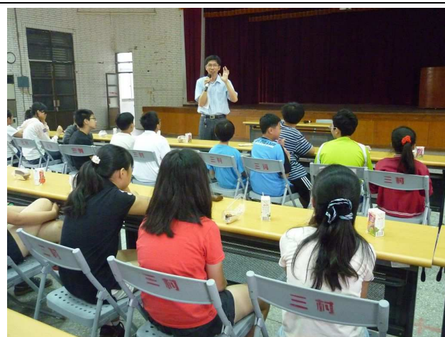
「我的校園生活」~與校長有約