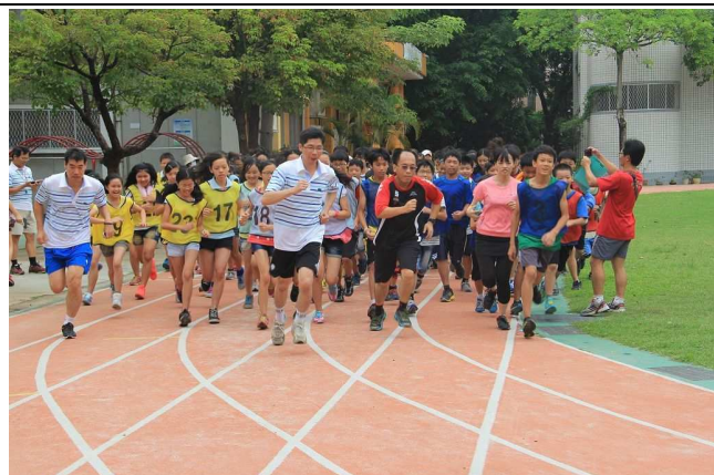
「村風少年 Pi」三公里路跑活動