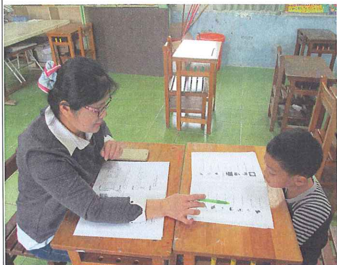
活動照片 3：說出日常用品