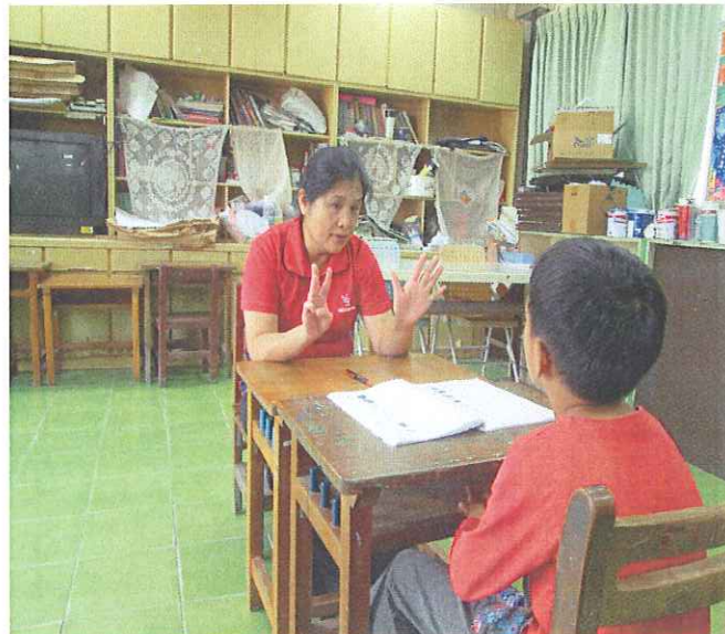
活動照片 2：認識數字