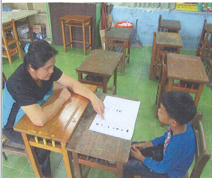
活動照片 1：拼音練習