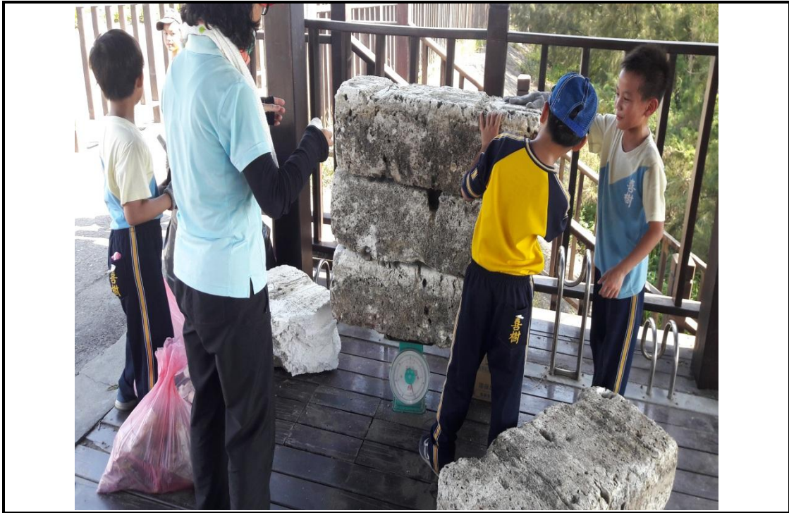
垃圾分類 垃圾減量