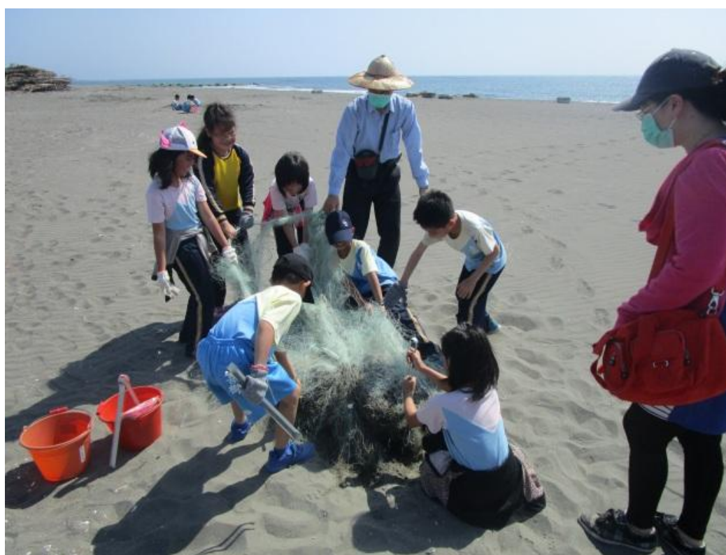
分組淨灘 我讓海灘變乾淨了