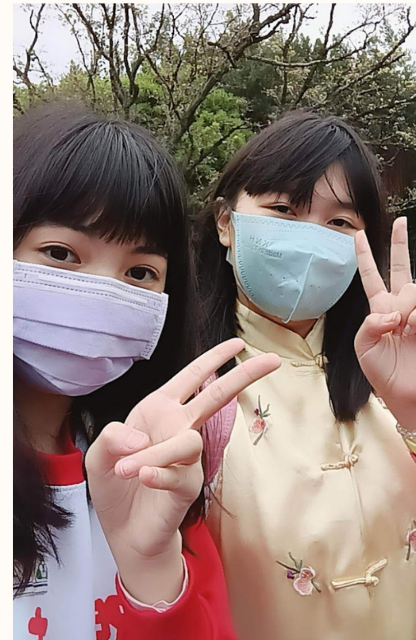
在二二八和平紀念公園，跟朋友一起拍照