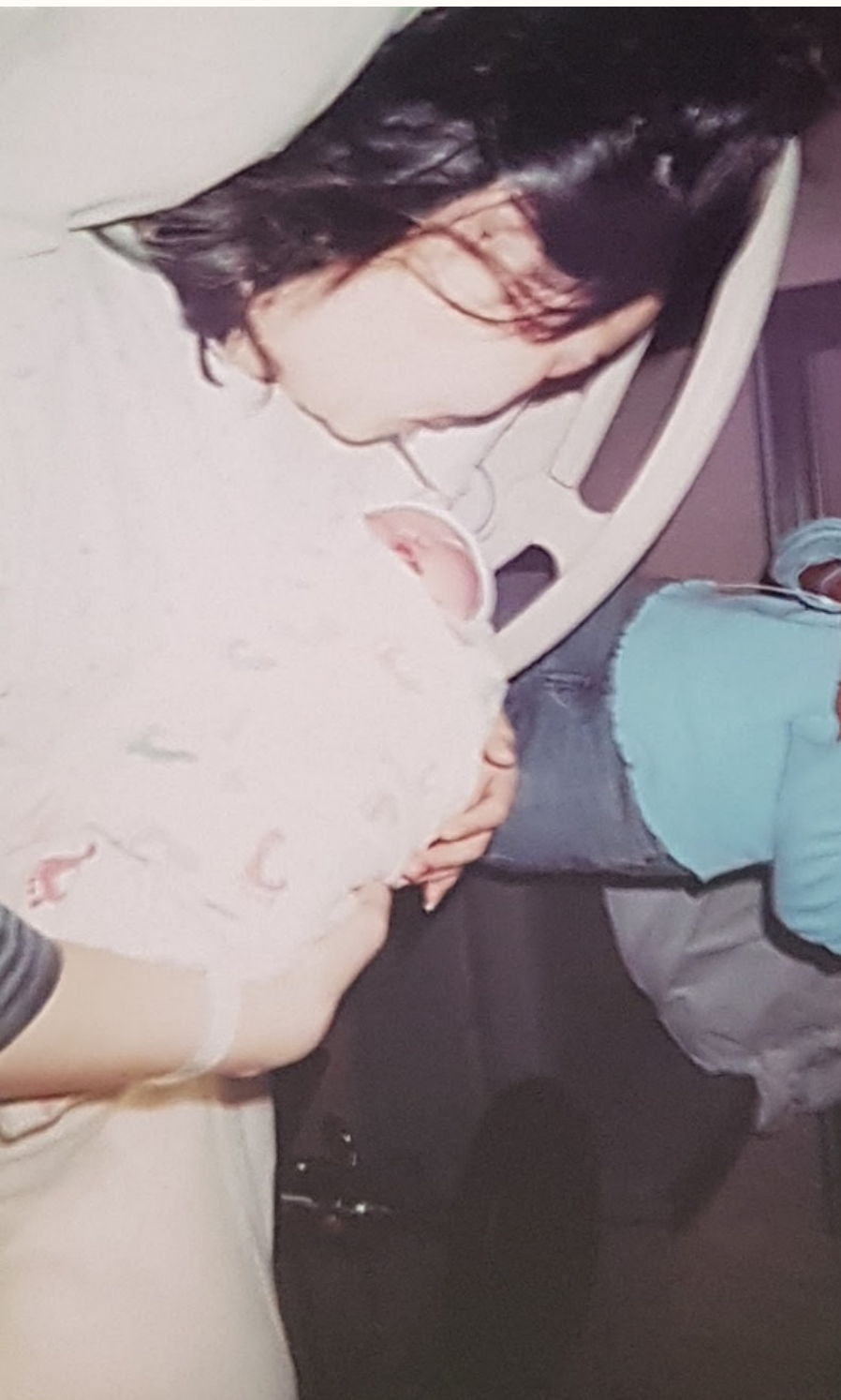
媽媽抱著剛出生的我，眼中滿滿的感動