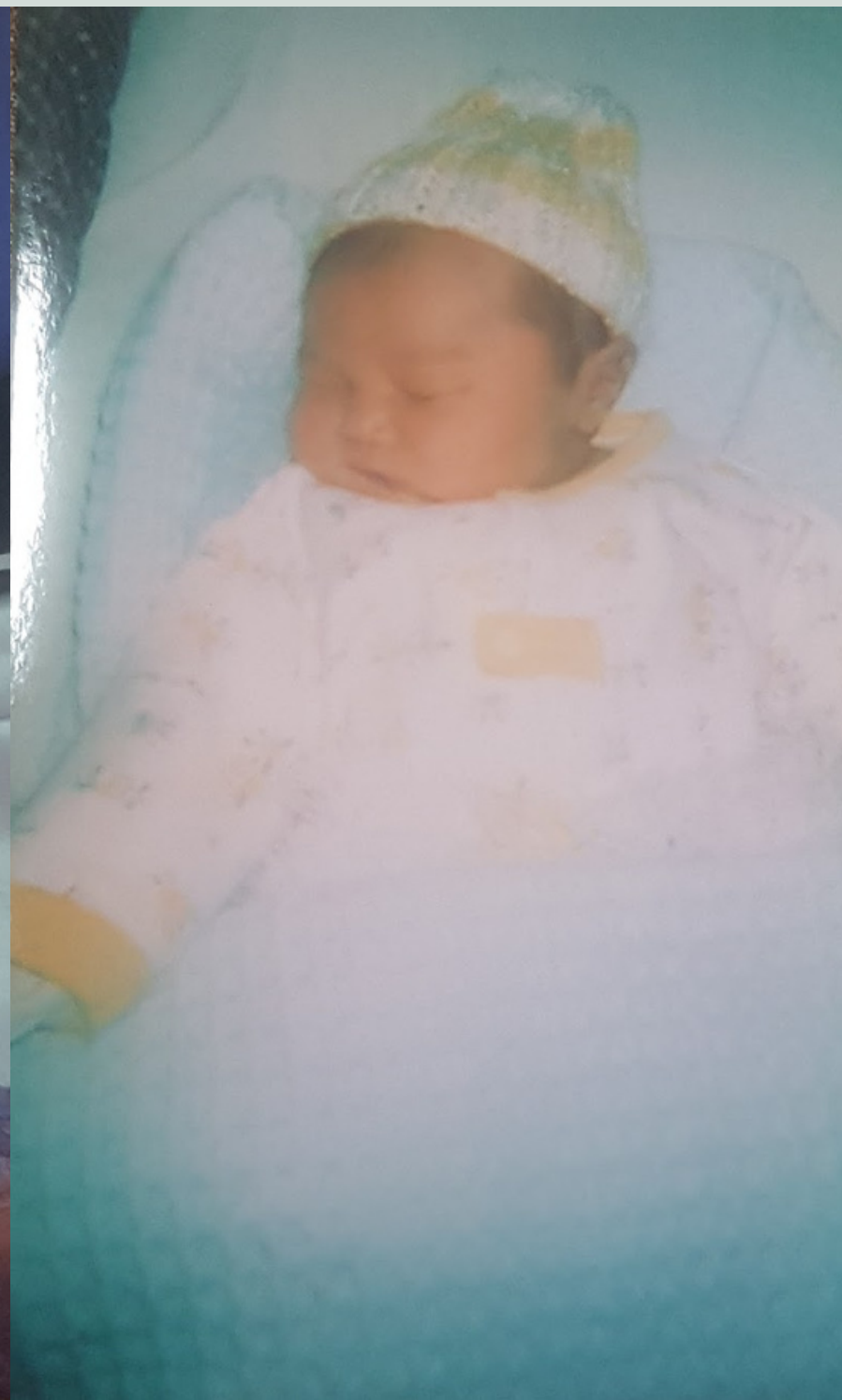
小時候睡覺的模樣，媽媽總是在我睡得很熟的時候拍照呢！