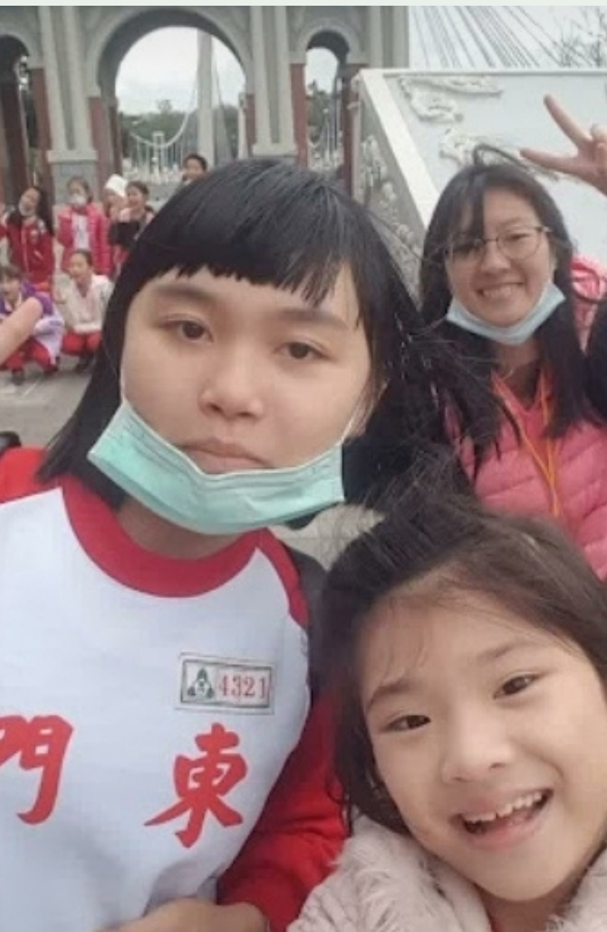
四年級戶外教學，在大溪橋，跟同學及老師合影自拍