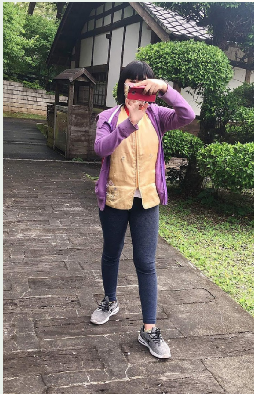
五年級的戶外教學，在一滴水博物館跟朋友戶拍