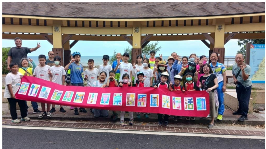
說明：盡一己之力維護家園美好環境