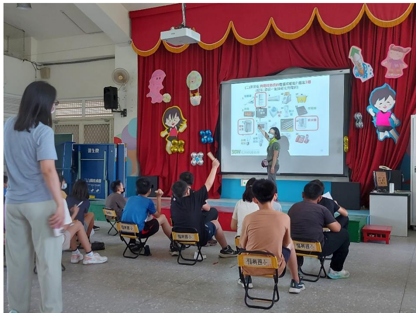
說明：高年級省電俠宣導