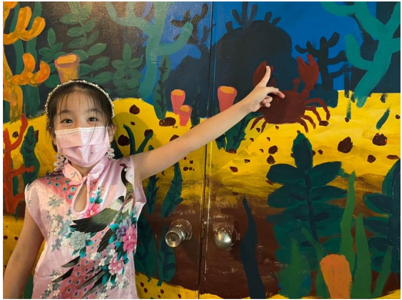
說明：閱讀藝文走廊