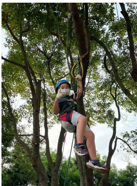
說明：低年級攀樹活動