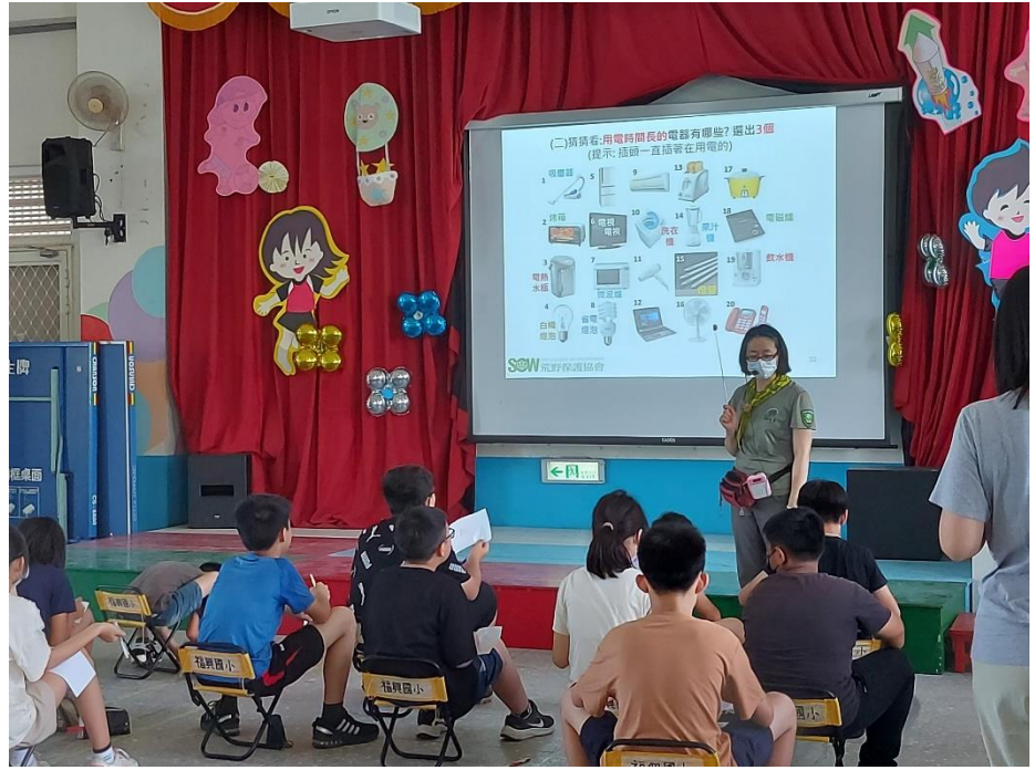
說明：高年級省電俠宣導