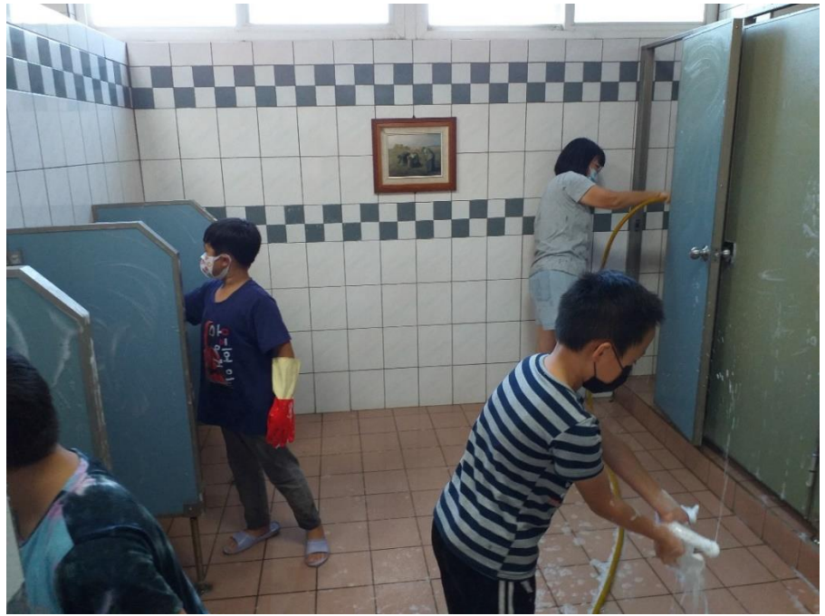
說明：高年級同學指導低年級同學共同完成清潔任務