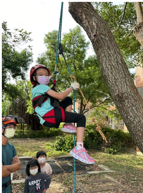
說明：低年級攀樹活動