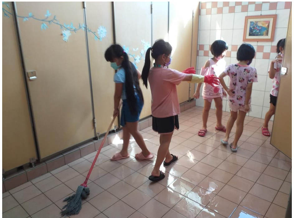
說明：學長指導低年級學地清潔地板