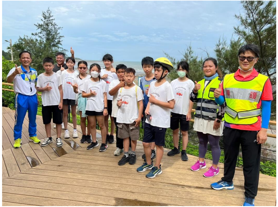
說明：師生一起淨灘