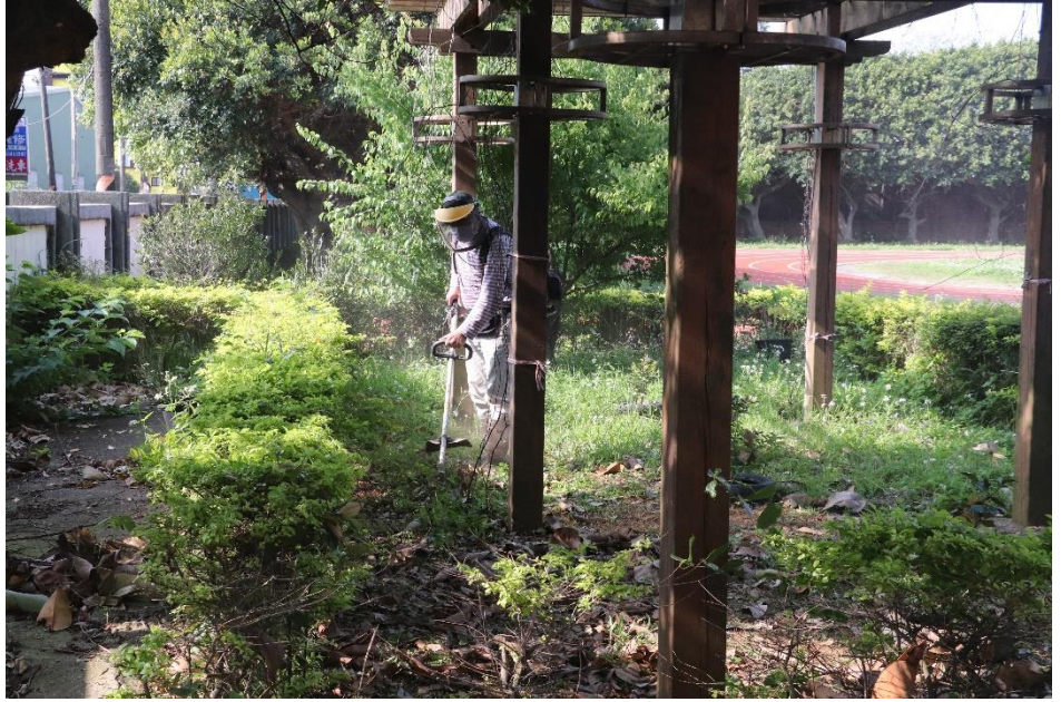
說明：整理綠牆施作基地