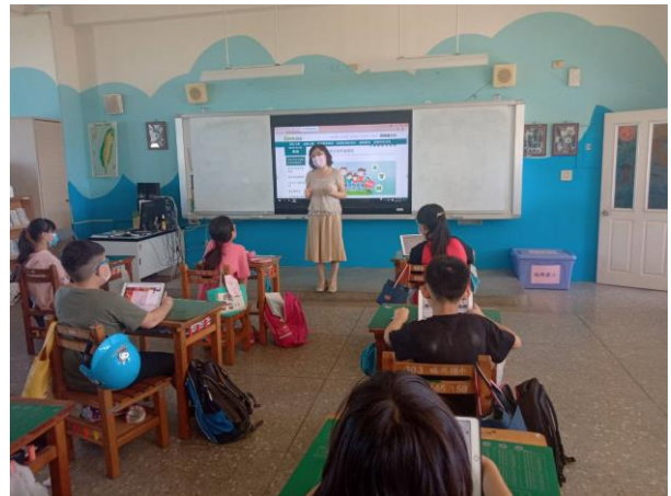
護理師入班針對空汙過敏族群予健康指導