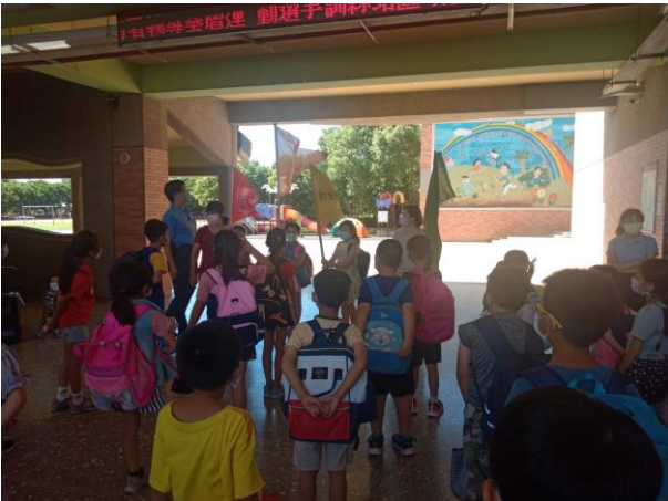
護理師全校性空汙議題施予健康指導宣講