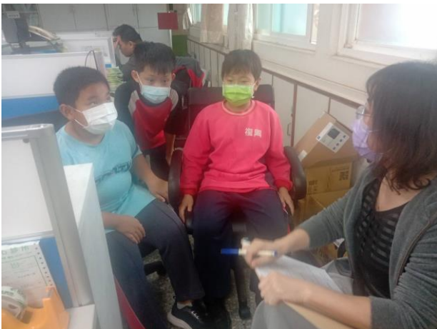
護理師空汙敏感施予個別衛教