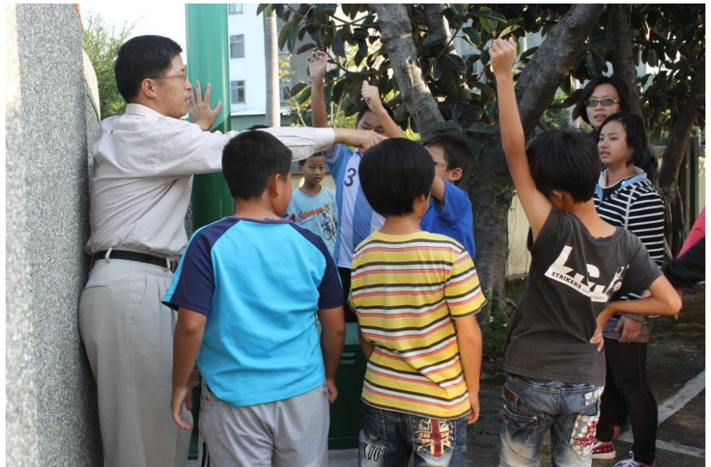
說明：能源教育教學