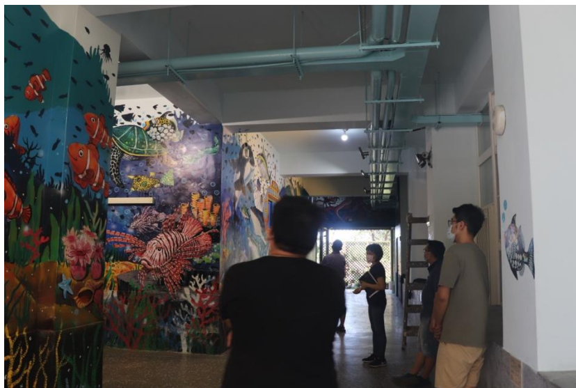
說明：閱讀藝文走廊