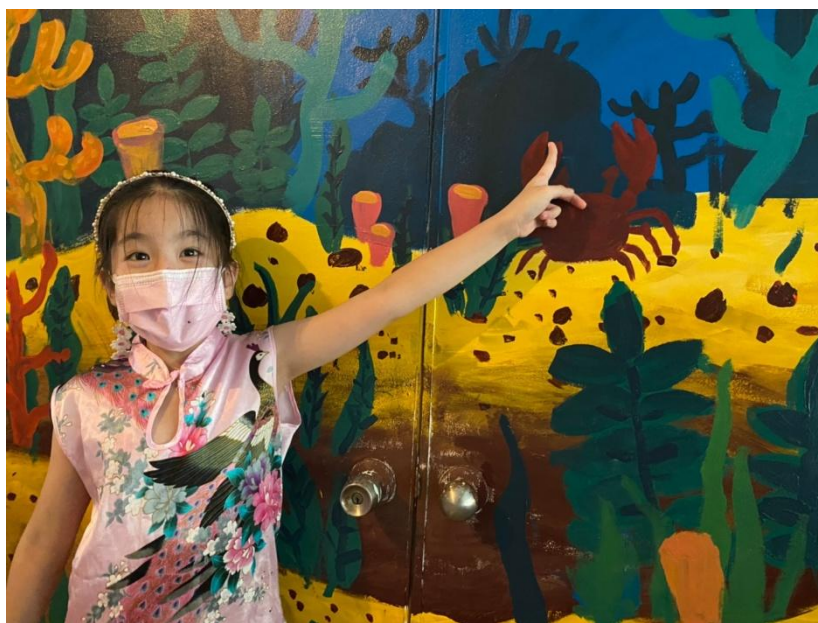
說明：閱讀藝文走廊