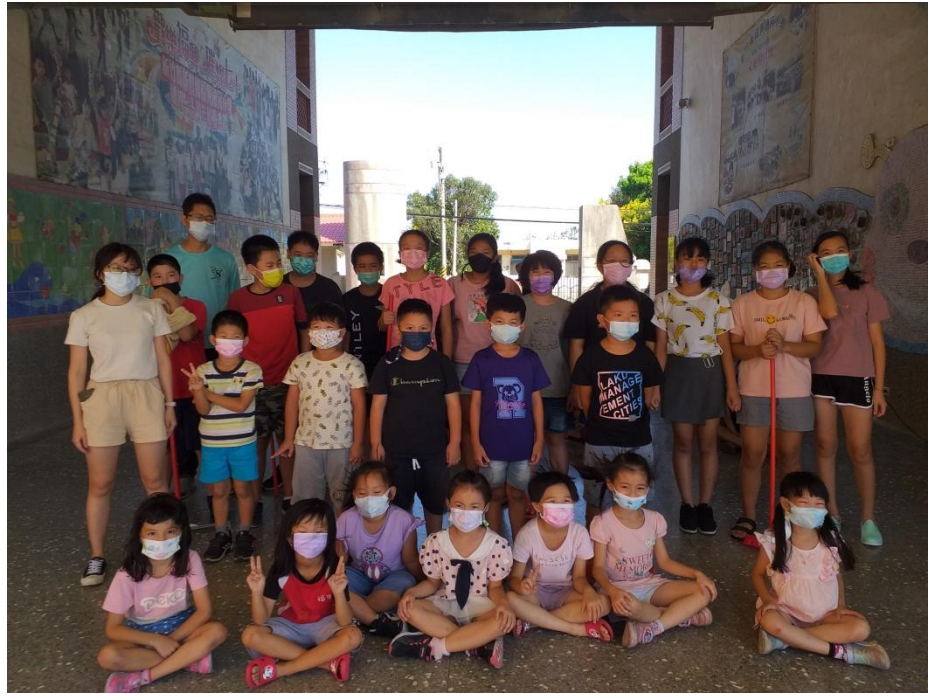
成 果 相 片 (2張)