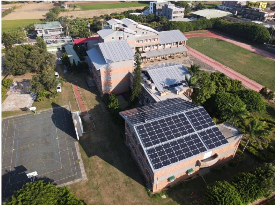
說明：校園屋頂設置太陽光電