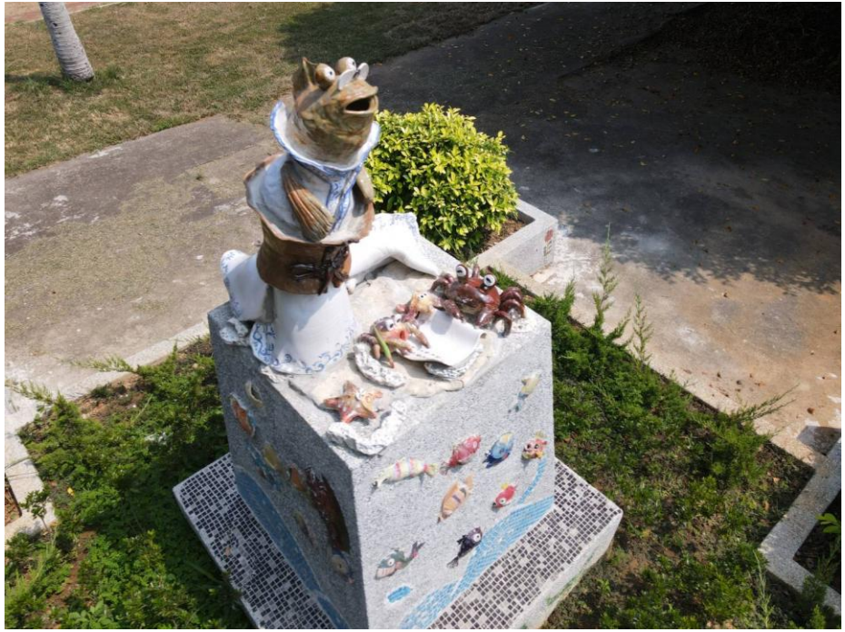
說明： 南側門地景藝術區