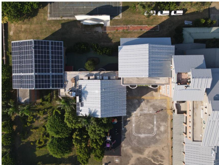
說明：校園屋頂設置太陽光電