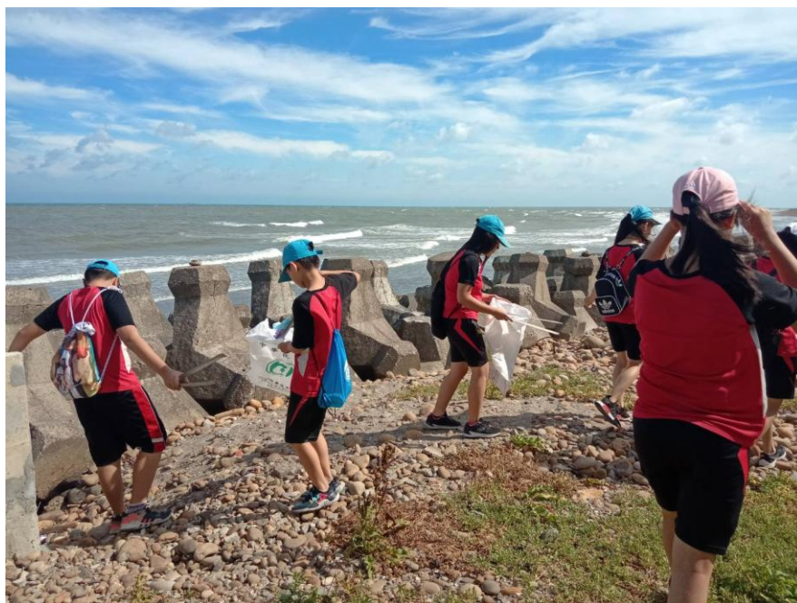
說明：盡一己之力維護家園美好環境