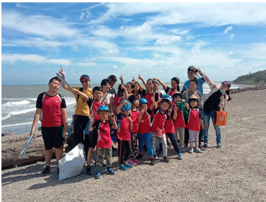
說明：師生一起淨灘