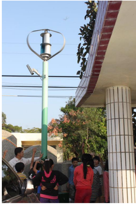
說明：風力發電教學