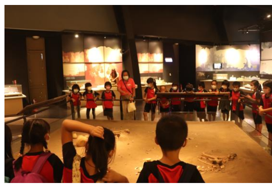
十三行博物館導覽(二)~殯葬文化解說