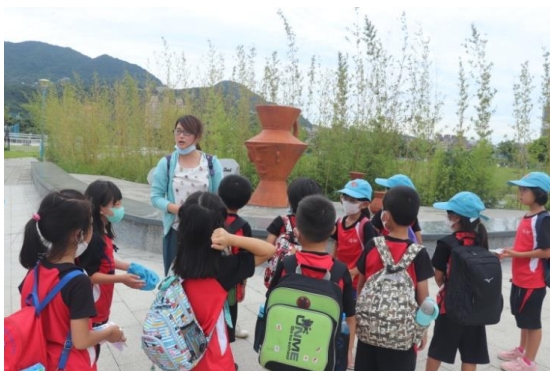
新北考古公園參觀~人面陶罐介紹