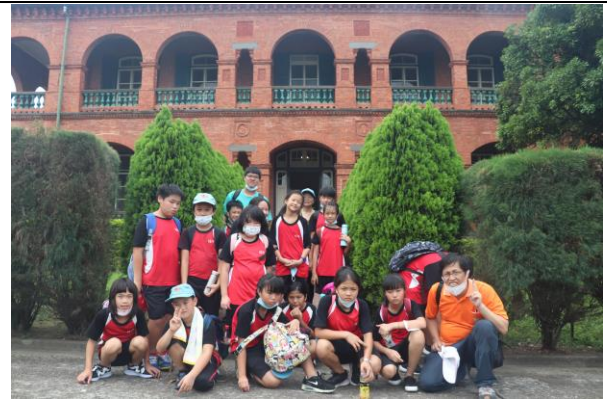
淡水老鎮導覽~紅毛城領事館