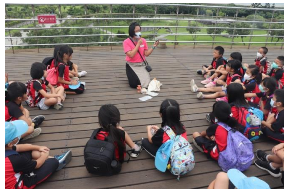
十三行博物館導覽(一)~介紹考古小物