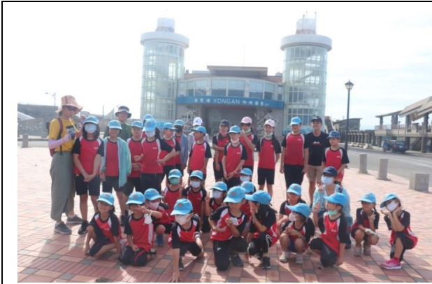
永安漁港漁市大樓前合影