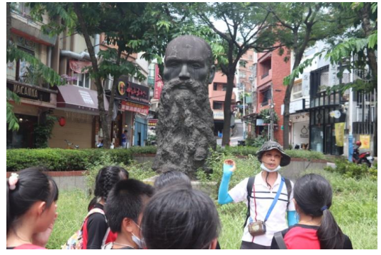
淡水老鎮導覽~歷史人物介紹(馬偕)