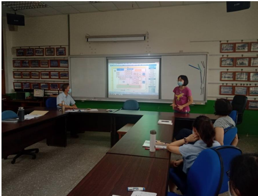
說明：全校防災會議