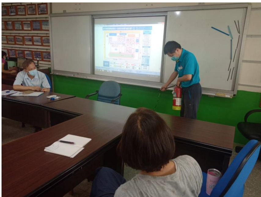
說明：滅火器檢查與操作