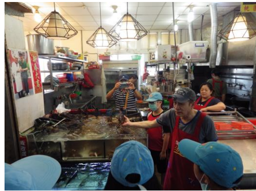
永安漁市參觀(一)~海洋生物介紹