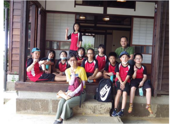
淡水老鎮導覽~淡水街長故居