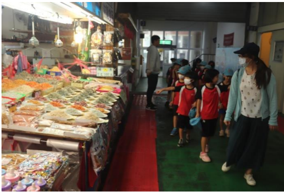
永安漁市參觀(二)~漁販商品展示