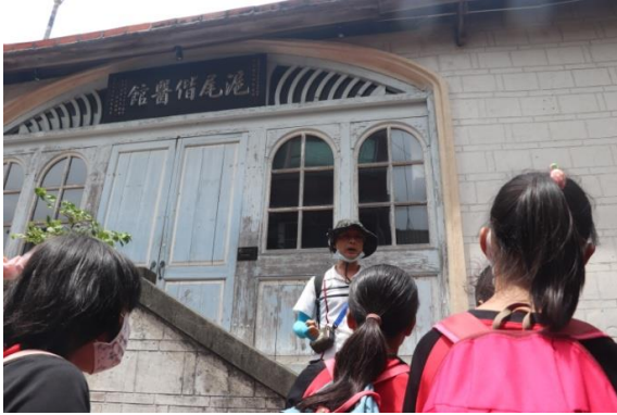
淡水老鎮導覽~滬尾偕醫館