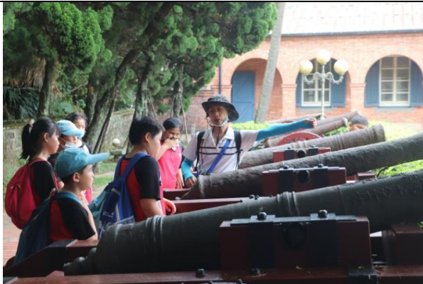
淡水老鎮導覽~滬尾古砲臺