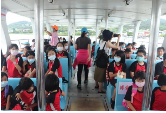
八里至淡水師生渡輪搭乘體驗(一)